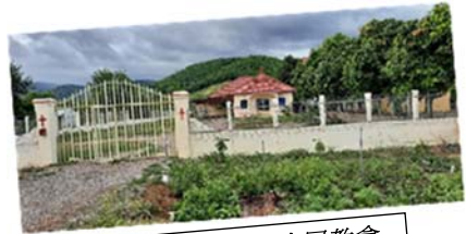
珠山白墟光屋教會