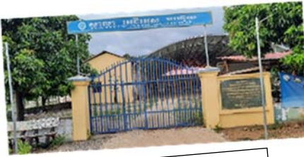
教會 Lighthouse Church