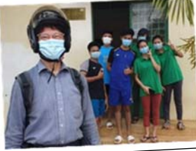
我與差會資助的部份升讀大學白墟小學舊生

感謝神的呼召帶領，亦感謝神在侍奉過程期間的延滯等待，讓我學到順服。感謝神在我們於中