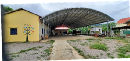
Pailin Bahuy School