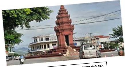
柬埔寨吳哥窟剪影