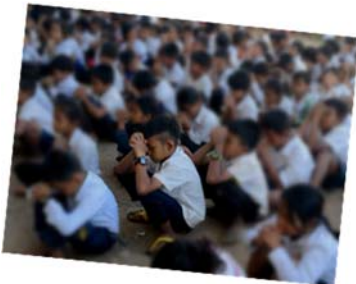
因維護私隱原故，所以未能提供有學生正面清晰樣貌的照片。