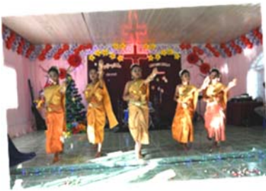
青少年於聖誕節在教堂以柬埔寨高棉傳統仙女舞 Apsara Dance 向神獻上感恩

感謝神的呼召帶領，亦感謝神在侍奉過程期間的延滯等待，讓我學到順服。感謝神在我們於中